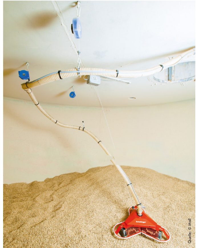
7 | Pneumatische Pelletentnahme als Alternative. Wird der Mall-Pelletspeicher mit Entnahmesystem bestellt, liefert der Hersteller einen Saugroboter mit flexiblem Schlauch und Adapterplatte. Dieser bewegt sich automatisch auf dem Brennstoffvorrat und entnimmt von oben. Der Heizkessel ist in diesem Fall mit einer Saugturbine ausgestattet.

[3] Lagerung von Holzpellets – ENplus-konforme Lagersysteme. Broschüre, 56 Seiten. Sechste komplett überarbeitete Auflage. 2024, DEPI Deutsches Pelletinstitut, Berlin. https://depi.de/ .