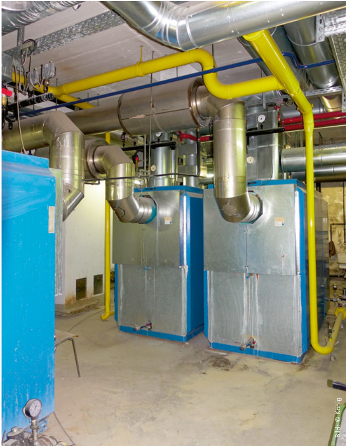
6 | Bisherige Heizzentrale. Die Wärmeversorgung wurde zuletzt monovalent über drei Gaskessel (2 x 1,15 MW, 1 x 1 MW) und ein Nahwärmenetz mit drei Strängen und 13 Unterstationen gewährleistet. Künftig wird die Grundlast mit einem Holzpelletkessel (500 kW) abgedeckt. Zwei neue Gasbrennwertkessel (2 x 1 MW) übernehmen die Spitzenlast.